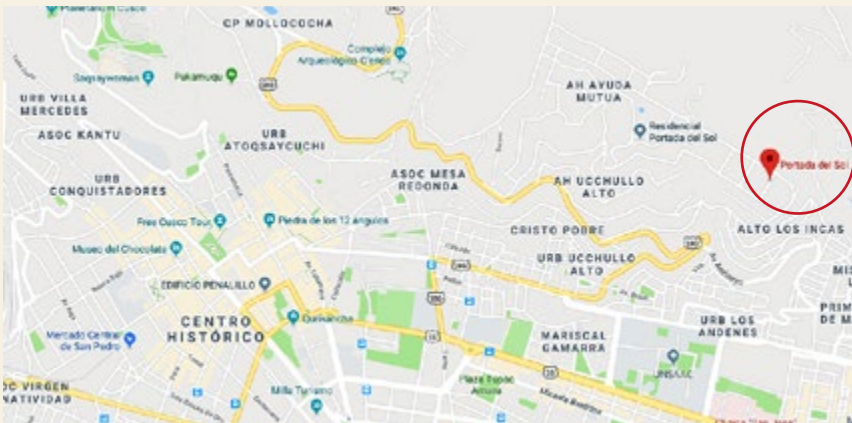
El proyecto Condominio Portada del Sol alberga 15 viviendas Techo Propio y cinco bajo el esquema Mivivienda.

Para la construcción del conjunto se ha optado por el sistema de muros de ductilidad limitada, con una proyección hacia tres pisos como máximo. El condominio ha sido asentado sobre un suelo estrato semirocoso de buena resistencia, además cuenta con cimientos corridos entre 0.8 a 1.5 m de profundidad.